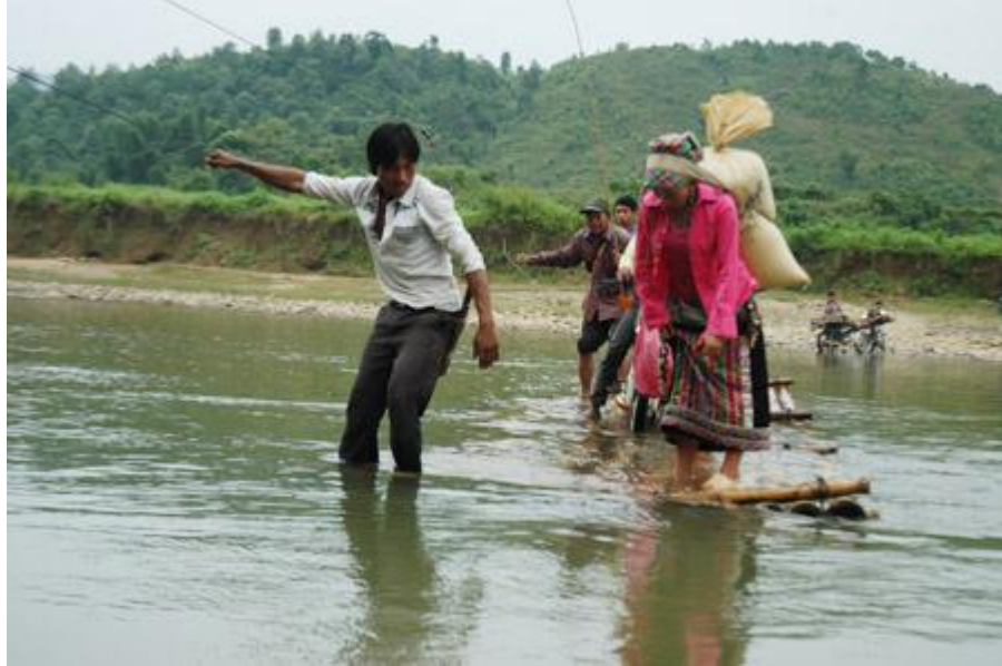
Một chuyến “phà” vào Phiêng Hào (dân chúng qua phà sợ bị thường luồng ‘ăn’)